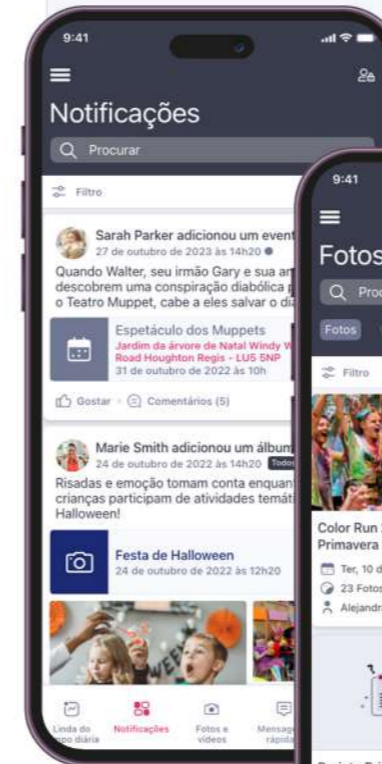
Aplicativo para Pais