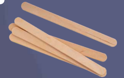
Bețe din lemn natur