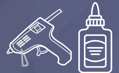
Pistol de lipit / lipici lichid